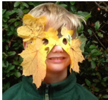
Grüner Mann Mythen

Schauen Sie sich die Bildnerische Erziehung Lern-Springboard an. Z.B. Wildes Tanzen und Feiern.