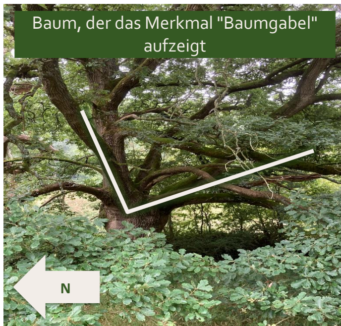
Baum, der das Merkmal "Baumgabel" aufzeigt